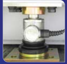
쉽고 간편한 로드셀 장착