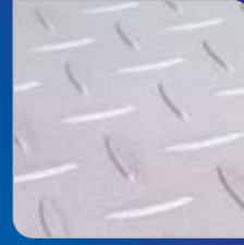
미끄럼 방지 표면