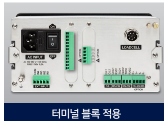
터미널 블록 적용