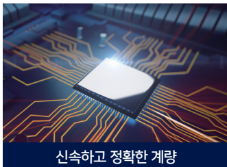
신속하고 정확한 계량