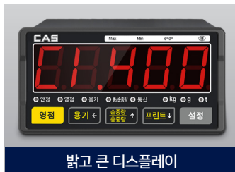
밝고 큰 디스플레이