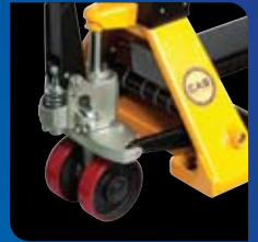
우레탄 바퀴 장착