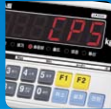
밝고 선명한 LED 디스플레이