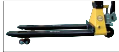
폴리 우레탄 바퀴

안정적인 구조는 계량 시 무게값에 대한 신뢰성과 정확성을 높여줍니다. 또한, 내구성이 좋은 우레탄 바퀴를 장착한 CPS PLUS 는 제품 운반작업과 계량을 같이 할 수 있어 작업장에서 작업시간 및 비용을 절감할 수 있습니다.