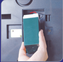
충전식 배터리 사용