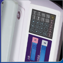
플라스틱&스테인레스 집판사용 부드러운 Rubber 스위치 사용