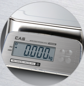
▲ Rear Display