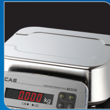
Stainless steel 집판