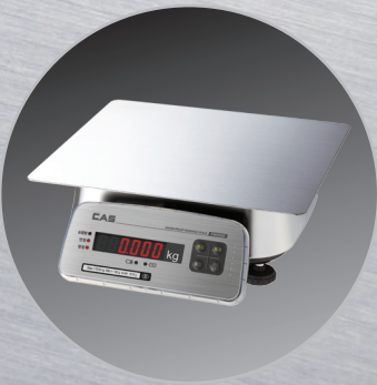
▲ Large tray