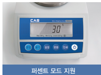
퍼센트 모드 지원