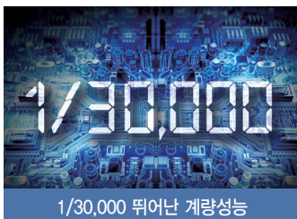
1/30,000 뛰어난 계량성능