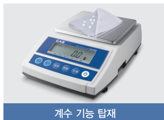
계수 기능 탑재