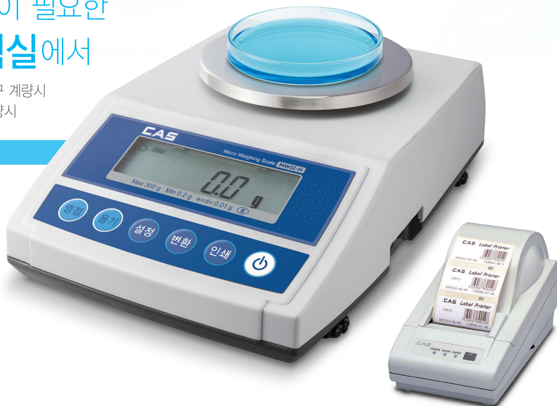
라벨 프린터 DLP-50 (선택사양)