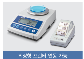
외장형 프린터 연동 가능