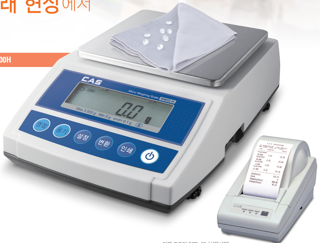
티켓 프린터 DEP-50 (선택사양)