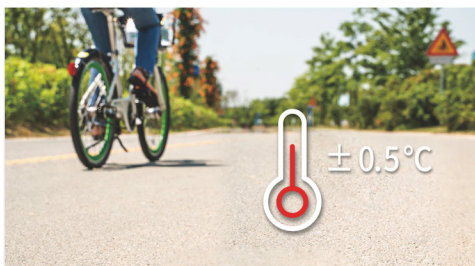
온도 오차범위 \pm 0.5^{\circ}\text{C} (일상온도)

순수 국산 기술로 개발, 제조한 정밀 측정 (영상&온도)용 열화상 카메라로 알림기능이 있어 편리하고, 원하는 곳 어디에나 손쉬운 설치가 가능하며, 위험 상황을 사전에 발견하고 방지할 수 있습니다.