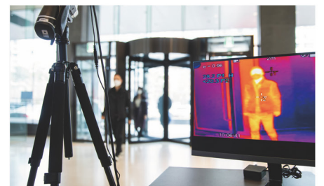
표준 삼각대 설치 및 노트북 활용 가능