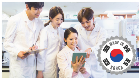
순수 국산 기술 개발/제조